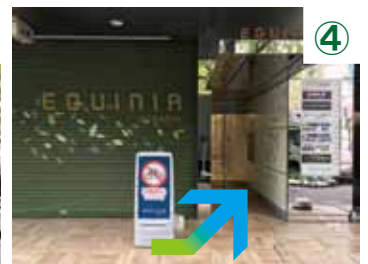
④ エントランスより、エレベーターで4階へお越しください。