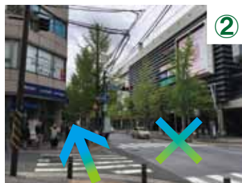
② みずほ銀行の前を通りそのまま道沿いに進みます（東急スクエア側への横断歩道は渡らないでください）。